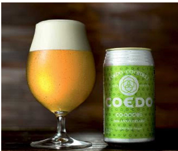
コープデリ 30周年 アニバーサリービール(イメージ)