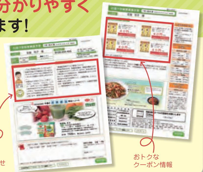
コープデリからののお知らせ

知りたい情報を見つけやすいよう項目ごとにご案内。 割引クーポンなどのお得なお知らせを掲載します。 お見逃しのないようご活用ください！