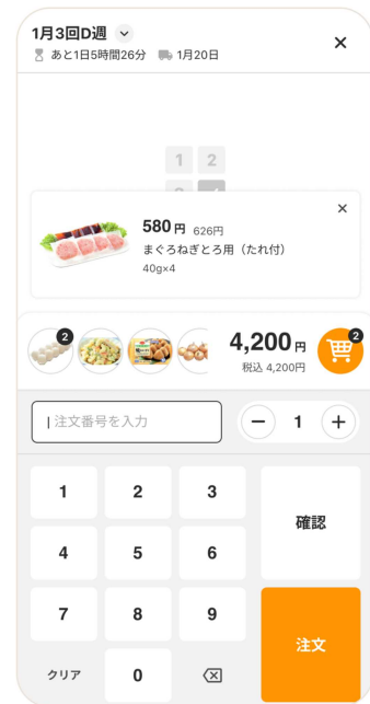
注文番号による注文画面(イメージ)

■コープデリ宅配アプリの詳細は、下記 URL または、専用の二次元コードよりご確認ください。