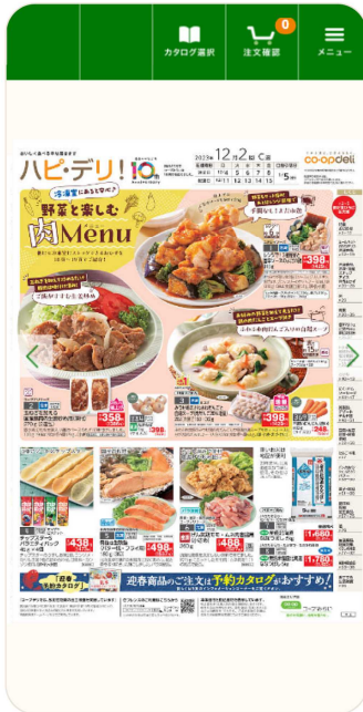
WEBカタログ(イメージ)

「コープデリ宅配アプリ」は今後も機能の追加や改善、コープデリが展開する各事業・サービスとの連携など、組合員の期待に応え、組合員一人ひとりの暮らしに寄り添ったサービスが提供できるようにしてまいります。