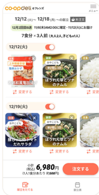
献立コンシェルジュ(イメージ)