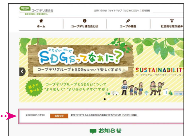
ホームページ画面のイメージ