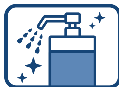
手指の消毒・手洗いを徹底