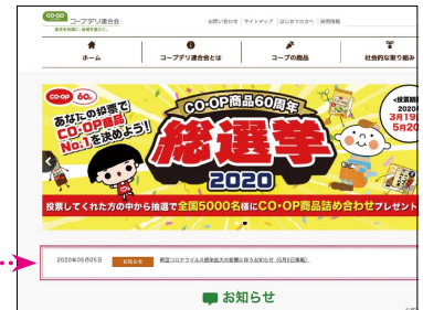
ホームページ画面のイメージ

※ご注文週は、一週間を通して「点数制限となる商品」や「欠品となる商品」一覧を掲載しています。