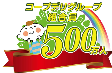
500万人到達記念ロゴ

コープデリ連合会の前身であるコープネット事業連合を1992年に設立して以来、会員生協それぞれの組合員数は順調に増加し、グループ合計の組合員数は、1992年度の会員5生協88万人から、会員7生協500万人を超えるまでとなりました。また事業高の合計は、1992年度の2,104億円から、2018年度の5,533億円へと増加しました。