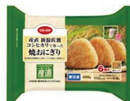
「CO・OP 産直 新潟佐渡コシヒカリで作った焼おにぎり」