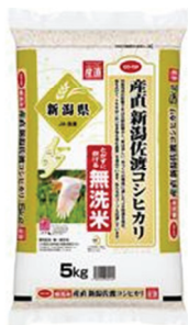
「CO・OP 産直 無洗米 新潟佐渡コシヒカリ」