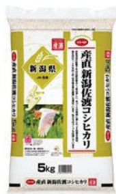
「CO・OP 産直 新潟佐渡コシヒカリ」