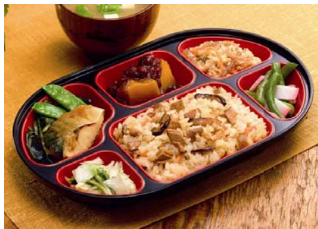
お弁当コース（ご飯付き）