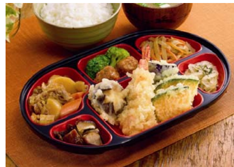
おかずコース（ご飯なし）