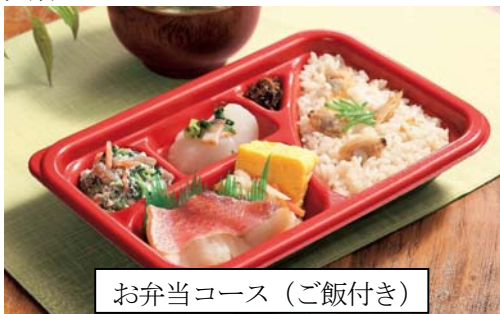
お弁当コース（ご飯付き）