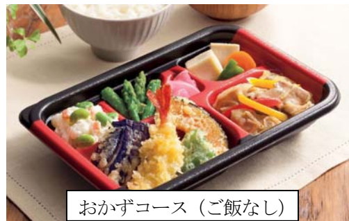
おかずコース（ご飯なし）