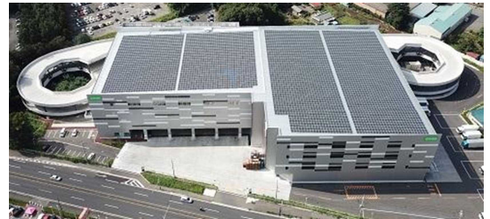
コープデリ連合会の物流センター(写真は野田船形グロサリー集品センター)に設置した太陽光発電パネルからの電力も組合員に供給

再生可能エネルギーで発電する「FIT電気」は、コープデリグループの物流センターや宅配センターに設置した太陽光発電施設をはじめ、店舗の生ごみや森林の間伐材を活用したバイオマス発電、またコープデリ連合会の農産物の産直生産者に協力いただき、生産者が設置している太陽光発電施設からの電力などを主な電源としています。